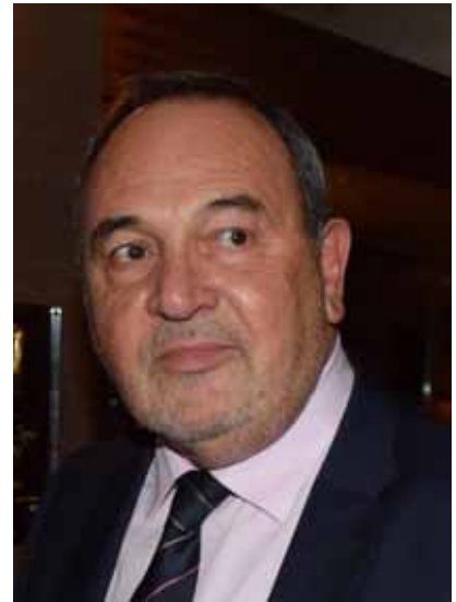
Στάθης Σκρέτας Γενικός Γραμματέας

Γιατί η ωφέλεια που θα προκύψει από την δουλειά μας, θα είναι συλλογική.